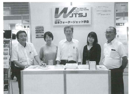
▲多数の来場者で盛況に