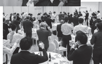
「乾杯」に声がそろう▶