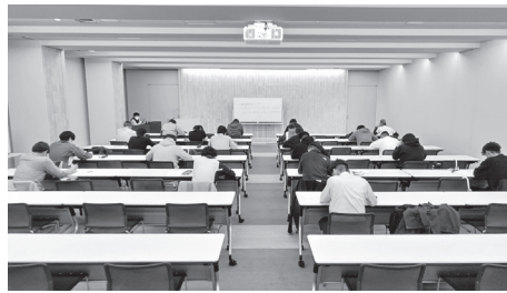
資格認定試験の様子

安全委員会では、昨年3月に実施した「防護服の防護性能確認試験」の結果の展開やホームページへの掲載などを行いました。また、2023年の年明けより『現場携帯手帳』の全面改訂に向けた作業を開始しています。イラスト図表の刷新、カラー化を実施する予定です。