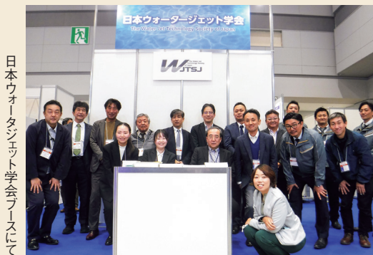
日本ウォータージェット学会ブースにて

なお、次回の洗浄総合展は、2026年11月18日から20日までの開催が予定されている。